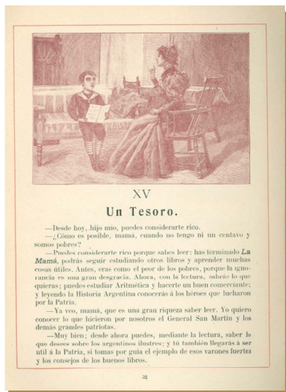
Lectura XV del libro “La mamá”. 1

Comencemos por la homogeneidad como meta , como efecto que se procuraba a través del trabajo escolar. La escuela argentina de fines del siglo XIX y principios del XX asumió un sentido determinado de la inclusión: transformó lo diverso en homogéneo unificando contenidos culturales, lenguaje, valores, experiencias estéticas... Al hacerlo, pagó el precio de la expulsión de lo distinto y de la